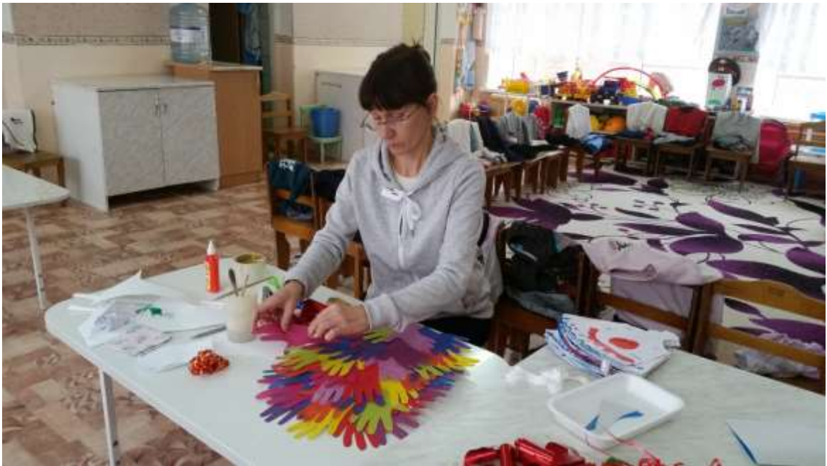
Поздравительная открытка «Пусть будет мир, он так нам нужен!..»