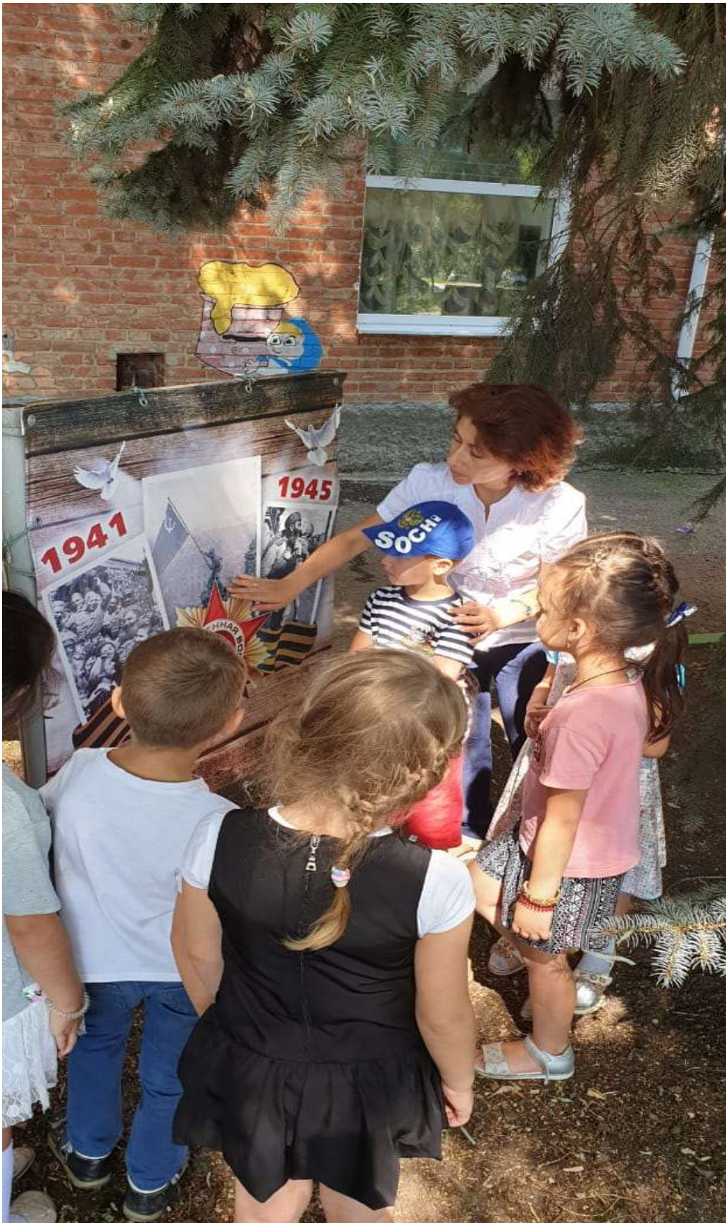
Экскурсия по территории детского сада.