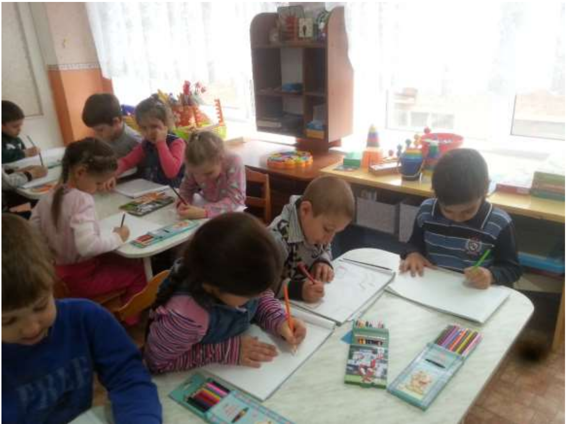
Рисование: «Военная техника»