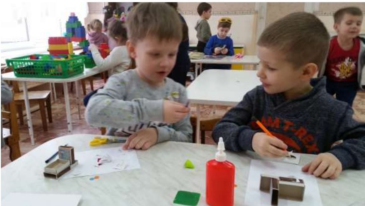
Конструирование из спичечных коробков: «Грузовик»