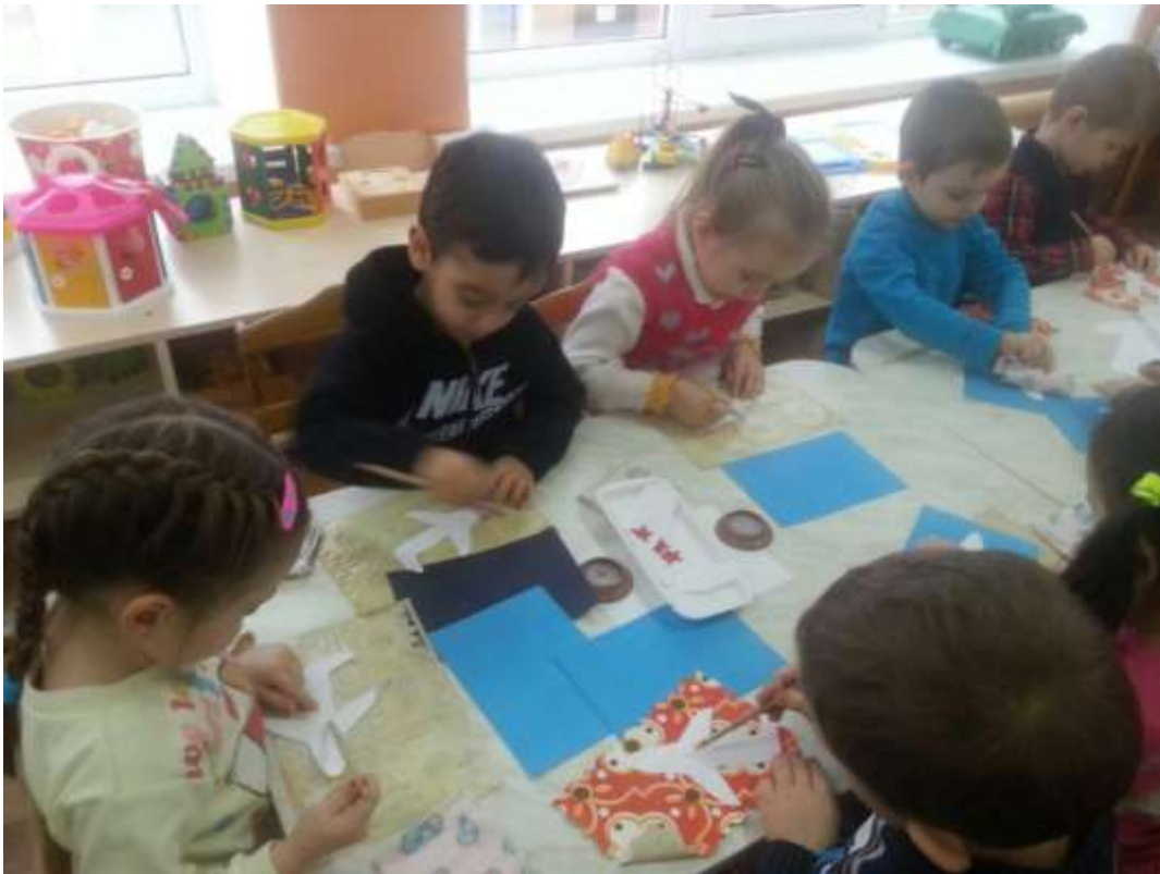
Аппликация: «Самолеты летят»